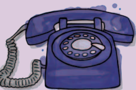
Ilustração: Beatriz Pimentel

Quem nunca passou ou está passando por uma situação difícil na vida e sem ter com quem dividir esse momento?